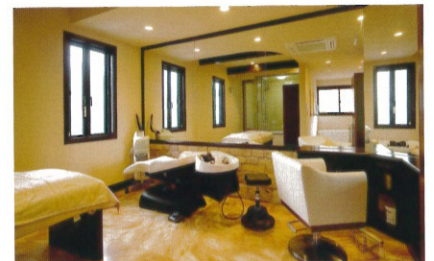
街中にある新しいスタイルの「湯治場」の『アプサライ』。

* Menu&Information / 毎月26日はお風呂の日-①岩盤浴が1,200円から(5名様一人あたり)②ディナービューフェ開催(お得なプランあり)